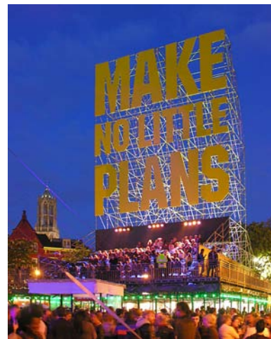
Architectenbureau Monadnock verzorgde het ontwerp van een 25 meter hoog bouwwerk op de Neude. Onder de enorme letters van de tekst Make No Little Plans bevond zich een ruime tribune, gericht op het podium.

In bijlage 1 (pagina 23) staat een overzicht van de eigen en coproducties, de programmering en de overige activiteiten op Festival a/d Werf 2010.