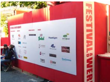
..... Sponsorbord op de Neude.

Huis en Festival a/d Werf heeft 2010 financieel positief afgesloten en een eigen inkomsten norm behaald van 25%.